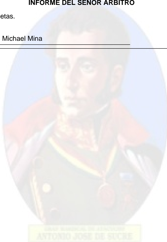
LIGA DEPORTIVA MARISCAL DE AYACUCHO ANTONIO JOSÉ DE SUCRE