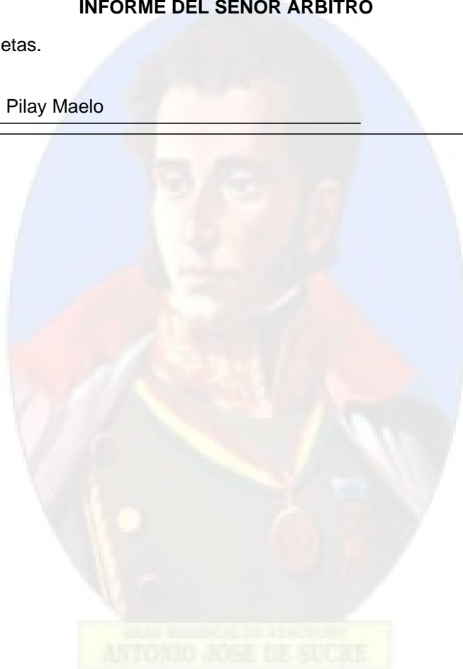
ANTONIO JOSÉ DE SUCRE