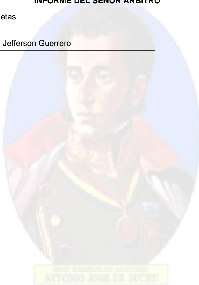
LEGA MARISCAL DE AYACUCHO ANTONIO JOSÉ DE SUCRE