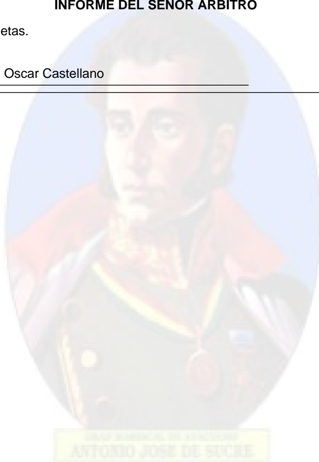
LIGA DEPORTIVA MARISCAL DE AYACUCHO ANTONIO JOSÉ DE SUCRE