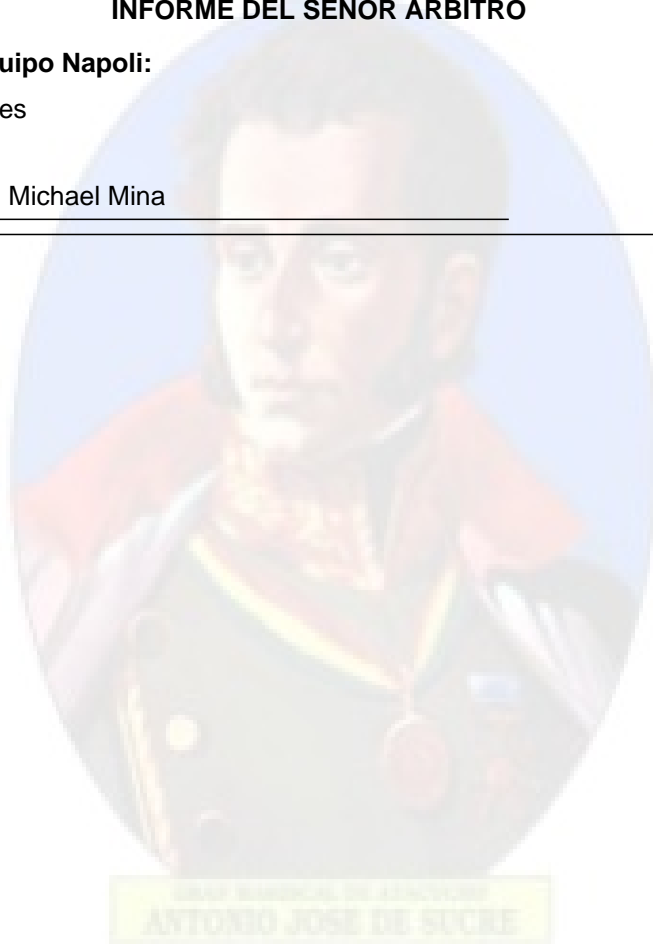
LEGA DEPORTIVA MARISCAL DE AYACUCHO ANTONIO JOSÉ DE SUCRE