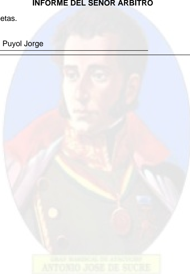
LIGA DEPORTIVA MARISCAL DE AYACUCHO ANTONIO JOSÉ DE SUCRE