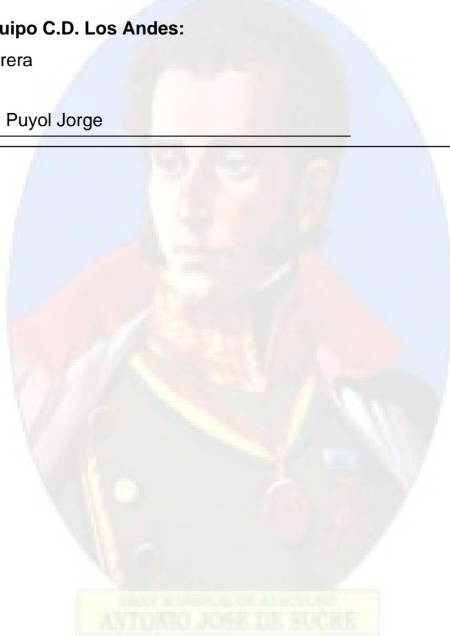
LIGA DEPORTIVA MARISCAL DE AYACUCHO ANTONIO JOSÉ DE SUCRE