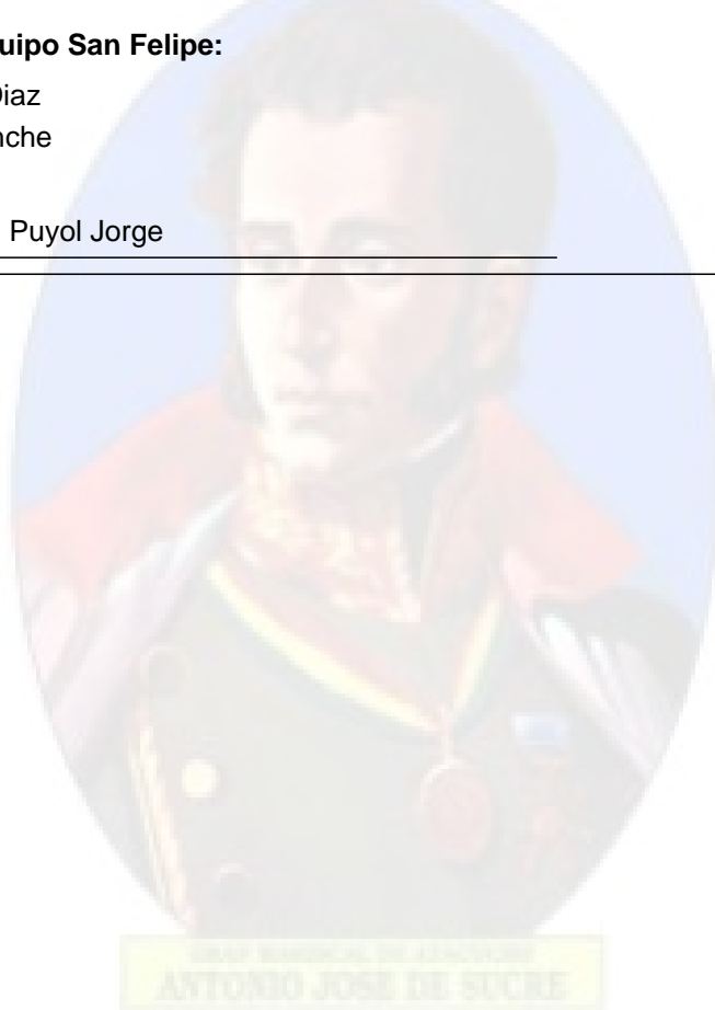
LIGA DEPORTIVA MARISCAL DE AYACUCHO ANTONIO JOSÉ DE SUCRE