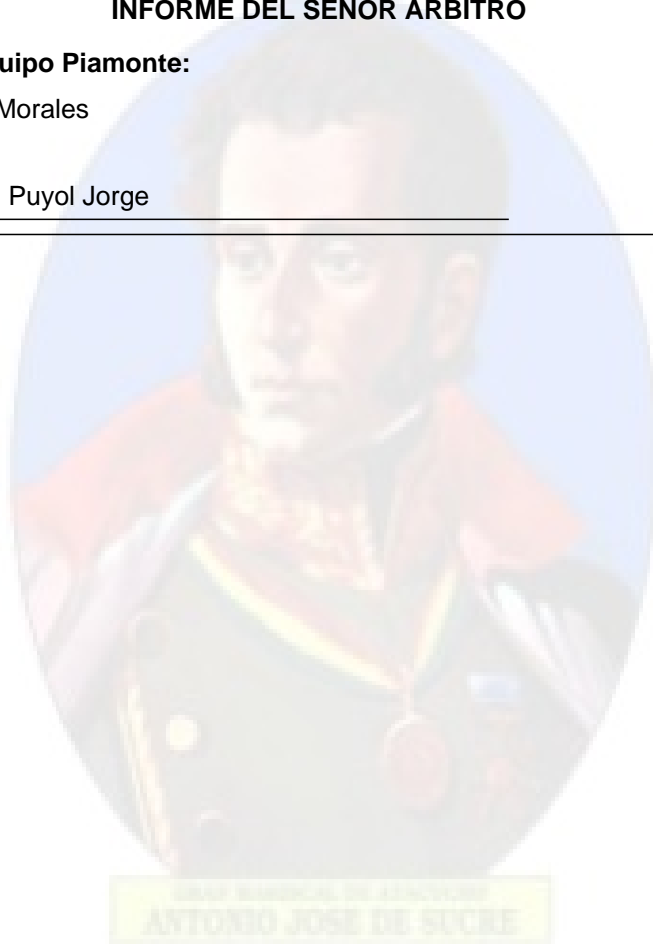
LIGA DEPORTIVA MARISCAL DE AYACUCHO ANTONIO JOSÉ DE SUCRE